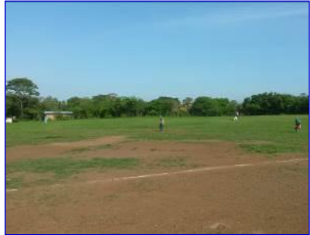
Vista panorámica del campo del estadio de beisbol Las Jaguitas sin proyecto.