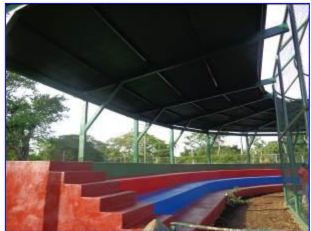
Vista panorámica del área de gradería techada y pintada.