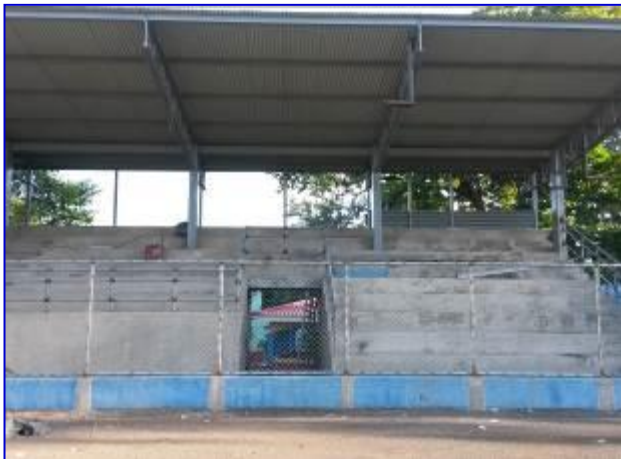
Vista panorámica de gradería costado norte, apreciar la instalación de malla ciclón, barandas metálicas de protección y louvers en el área de gradería.

Está siendo ejecutado por el contratista Ricardo José Murillo Rodríguez, por un monto de C$ 5,500,000.00, sin embargo se realizó Adendum N° 1 al contrato por incremento en el monto de C$ 851,490.89, para un monto final de C$ 6,351,490.89. La obra inicio el 23 de junio 2015, con un período de ejecución de 95 días calendario; se realizó ampliación al plazo del contrato por 30 días calendario, para un total de 125 días calendario, teniendo previsto finalizar el 25 de octubre 2015.