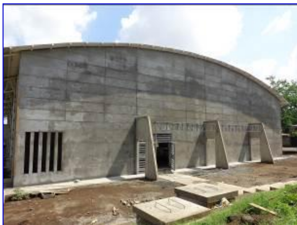
Fachada costado sur del Gimnasio de Gimnasia, donde se aprecia acabo fino en paredes, portón metálico y andenes de conexión.

El plazo de ejecución del proyecto es de 119 días calendario. La obra inicio el 23 de junio 2015 con un plazo ejecución de 119 días calendario, finalizado el 20 de octubre 2015.