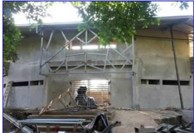
Fachada principal del Estadio Amistad Dodgers, observar la instalación de portón de acceso y fachada principal metálica.

El proyecto consiste en el Reemplazo del acceso principal y graderías del Estadio de Beisbol Infantil Amistad Dodgers, el cual contará con áreas tales como: vestíbulo de acceso, graderías bajo techo, palco, cabina de transmisión, 6 bodegas bajo graderías, 2 dugouts para los atletas dotados de vestidores y servicios sanitarios, 4 Baterías de servicios sanitarios para el público, área para técnicos, pasillos de circulación,