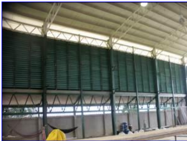
Fachada costado sur (vista interna) donde se observa la instalación de louvers (parte superior) y verjas de protección (parte inferior).

El proyecto esta siendo ejecutado por el Contratista PROYENITSA, por un monto inicial de C$ 3,207,755.13; sin embargo se realizó adendum N° 1 por un monto de C$ 546,335.49, para un monto final de C$ 3,754,090.62. El plazo de ejecución del proyecto es de 65 días calendario, se realizó ampliación al plazo por 45 días calendario, para un total de 110 días calendario, se tiene previsto la finalización del mismo para el 26 de octubre 2015.