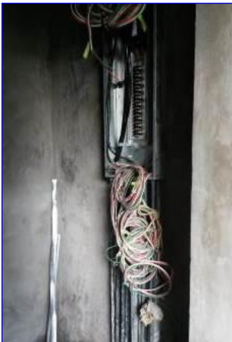
Vista interna del cuarto de panel eléctrico, donde se aprecia la instalación de canalización, cableado y panel eléctrico.

Se pagó el Avalúo No. 11 por un monto de C$ 726,657.74 que corresponde al 6.53 % de avance físico para acumular el 71.73% de ejecución total.