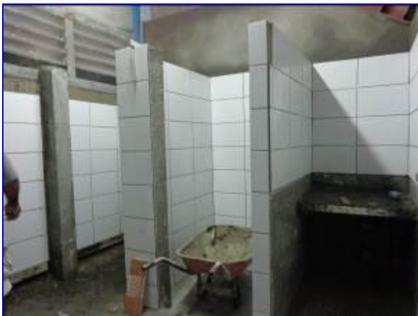
Vista interna del área de camerino (costado sur debajo gradería) de las instalaciones del Gimnasio de Boxeo. Observar el suministro e instalación de enchape de azulejos en servicio sanitario.

Durante el mes de septiembre se continuó con la instalación de electropaneles en gradería y paredes internas, repello y fino integral en las paredes de cerramiento, enchape de azulejos, verjas metálicas. Se pagó el Avalúo No. 4 por un monto de C$ 556,815.01 que corresponde al 14.26 % de avance físico para acumular el 71.83 % de ejecución total.