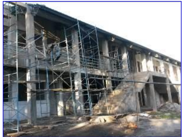
Vista panorámica del edificio nuevo del ENEFYD, donde se observa la instalación de la cubierta de techo.

En el mes de septiembre se continuó con el repello y fino, enchape de azulejos, instalación de pisos, cielo falso, suministro e instalación de tuberías y alambrado del sistema eléctrico, construcción de paredes de concreto, construcción de la caseta del sistema de bombeo hidroneumático, instalación de la cubierta de techo.