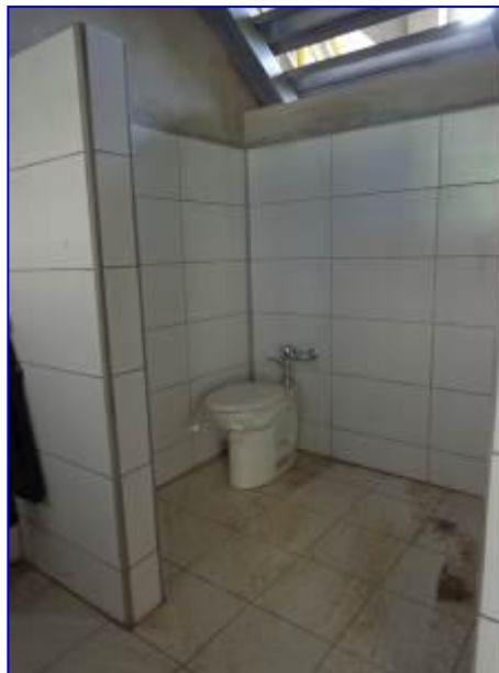
Vista interna del área de batería sanitaria donde se aprecia el enchape de azulejos en paredes e instalación de inodoros.

El proyecto consiste en la construcción de losa de piso, obras sanitarias, obras eléctricas, puertas, ventanas, cielos, pintura y obras exteriores. Esta siendo ejecutado por el Contratista Tomás Robleto Lira, por un monto de C$ 13,102,665.80.