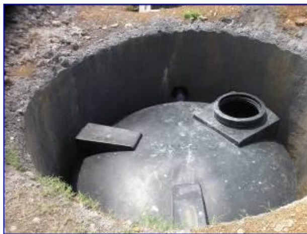
Observar la construcción de fosa séptica.

En este periodo se tiene un avance físico financiero de 61.47%, se realizó pago por un monto de C$1,418,090.98, dando continuidad a la construcción de obras exteriores e iniciando con la construcción de paredes especiales de durock, suministro e instalación cerámica, enchape de azulejos, de ventanas, obras eléctricas y obras exteriores.