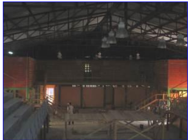
Vista interna del Gimnasio de Boxeo, donde se aprecia la instalación de luminarias tipo campana y graderías en ambos costados.

En el mes de septiembre, se realizó recepción sustancial de proyecto. Se continuó con la ejecución de los acabados en graderías, fascia, instalación de luminarias, finalización del sistema de infiltración de agua pluvial y aguas negras.