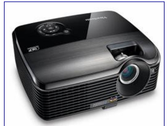
Suministro de 2 DATA SHOW o Proyector.

En el mes de septiembre se realizó la recepción de los bienes escritorios y sillas de docentes, sillas de estudiantes, 2 pantallas para datashow, quedando así finalizada la obra. Se realizó el pago por un monto de C$575,431.91, para un avance físico 100%, quedando pendiente para el mes de octubre la cancelación del proyecto.