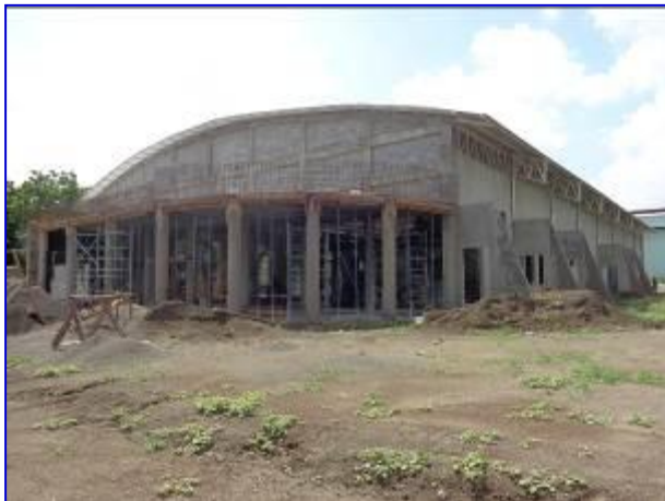
Vista panorámica del edificio de Gimnasio de Gimnasia, donde se aprecia la construcción de acceso principal y obras exteriores.

El proyecto consiste en la construcción de losa de piso, obras sanitarias, obras eléctricas, puertas, ventanas, cielos, pintura y obras exteriores. Esta siendo ejecutado por el Contratista Tomás Robleto Lira, por un monto de C$ 13,102,665.80.