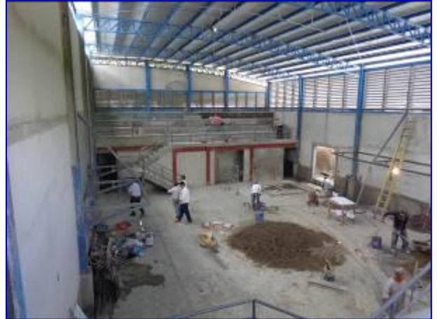
Vista interna (costado sur) del Gimnasio de Boxeo en Somoto, donde se aprecia la construcción de las graderías con electropaneles al fondo y losa de piso de concreto al centro (donde se instalara el cuadrilátero).

Esta siendo ejecutado por el Contratista Tomás Robleto Lira, por un monto de C$ 3,264,263.71, se realizó adendum N° 1 al contrato por un monto de C$ 639,401.54, para un monsto total de C$ 3,903,665.25. El plazo de ejecución del proyecto es de 98 días calendario, se concedió ampliación de plazo de 30 días, para un total de 128 días calendario, teniendo como fecha prevista de finalización el 08 de octubre 2015.