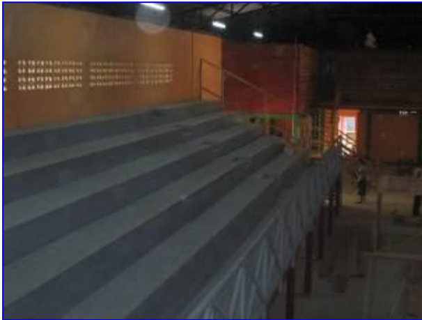
Apreciar las graderías ya finalizadas y baranda de protección, costado Este.

El proyecto consiste en la ejecución de la etapa final, la cual contempla las etapas de mampostería, acabados, cielo raso, pisos, puertas, obras metálicas, obras sanitarias, electricidad, obras misceláneas, impermeabilización de techo.