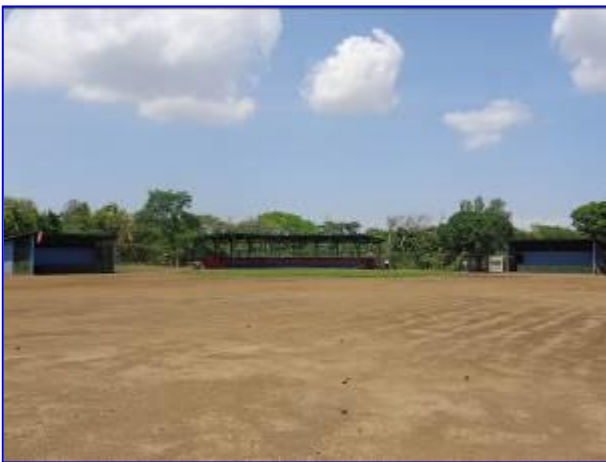
Vista panorámica del área de campo deportivo, aprecia la nivelación del terreno, área de infield con grama y al fondo se observa área de gradería techada.

El 30 de septiembre se realizó recepción final del proyecto. Se tiene un avance financiero del 94.67%, quedando pendiente para el mes de octubre un pago correspondiente a un monto de C$ 230,616.63.