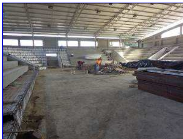
Vista interna del Gimnasio de Boxeo Alexis Arguello, a la izquierda se puede apreciar situación sin proyecto, en la fotografía de la derecha apreciar el inicio de ejecución de las obras con la limpieza general del sitio.