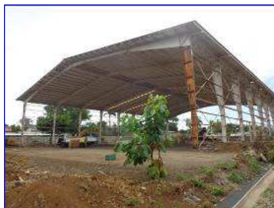
Panorámica costado Noreste del Gimnasio de Baloncesto en el Polideportivo España, a la izquierda apreciar el Gimnasio situación sin proyecto. En la fotografía de la derecha apreciar situación actual del proyecto.

En el mes de Diciembre se tuvo un avance del 2.45%, en la ejecución de las demoliciones de paredes internas y pisos de las oficinas, servicios sanitarios, desinstalación de las paredes de cerramiento de láminas troqueladas, desinstalación de la cubierta.