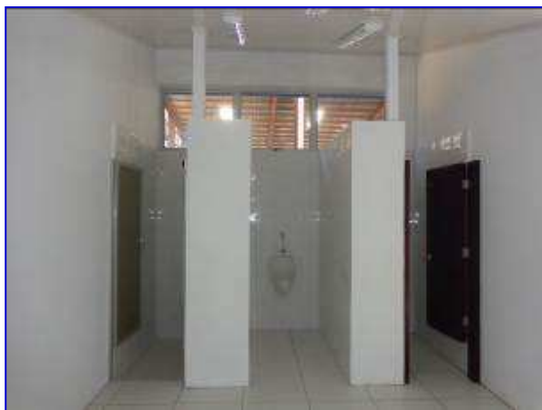
Vista interna del área de servicios sanitarios árbitros - Gradería Este, donde se aprecia la ejecución de las actividades de pisos, lámparas, puertas de aluminio y lámina acrílica rugosa, instalación de aparatos sanitarios.

El proyecto consiste en la construcción de la gradería Oeste de la cancha de volibol, con un área de 161 m 2 y capacidad para 317 personas. Debajo de graderías tendrá los ambientes de camerinos y servicios sanitarios para jugadores, bodegas, caseta del vigilante y escaleras de accesos. Se finalizará además la gradería Este con las obras de piso, cielo raso, puertas, ventanas, electricidad, fontanería, acabados y pintura en general; así como los acabados finales en las fachadas Norte y Sur.