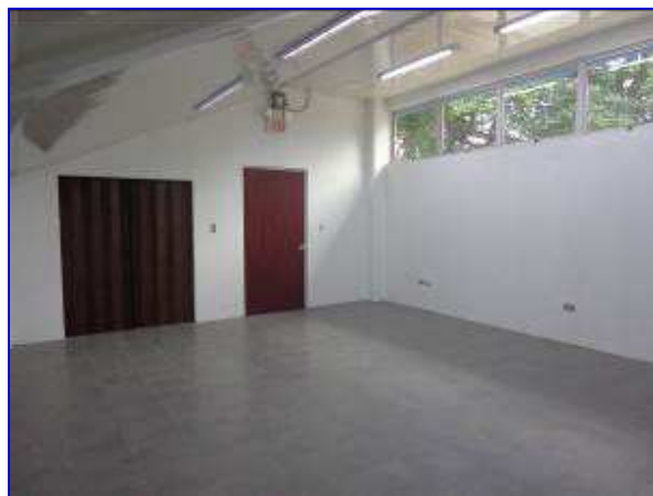
Vista interna de la sala de reuniones – Gradería Este, donde se observa la ejecución etapa de puertas, ventanas, lámparas, piso, cielo raso.

El proyecto está siendo ejecutado por la empresa Construcciones Torres Blandón; por un monto total de C$ 8588,240.35 con Adendum N° 3. La obra se inició el 05 de mayo 2016, con un plazo de ejecución total de 215 días calendario con Adendum N° 2.