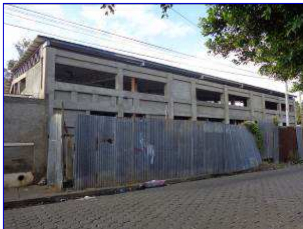
Observar en ambas fotografías situación actual del Gimnasio Alexis Arguello, situación sin proyecto.