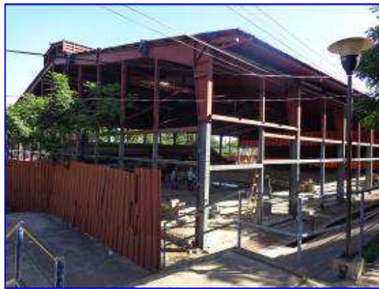
En ambas fotografías apreciar las instalaciones del Gimnasio de Combate situación sin proyecto. A la izquierda observar panorámica del Gimnasio y a la derecha vista interna.

En el mes de diciembre 2016 se inició la ejecución de las actividades de construcción de cerca perimetral de protección, demoliciones de paredes de baños y desinstalaciones de louvers, aparatos sanitarios y cerramiento de las paredes costado norte, oeste y sur.