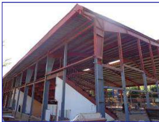
En ambas fotografías apreciar las instalaciones del Gimnasio de Combate situación sin proyecto. A la izquierda observar panorámica del Gimnasio y a la derecha vista interna.